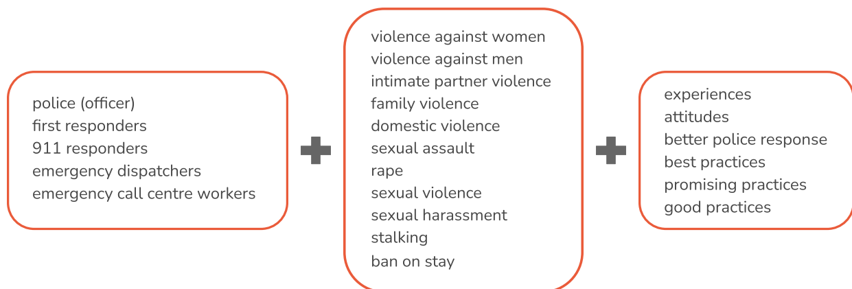
Joonis 1. Otsingus kasutatud märksõnad

Kirjanduse ülevaate jaoks tehtud otsingutes kasutasime kõiki ülaltoodud termineid (nii eesti kui inglise keeles) (vt arutelu nende mõistete üle Pettai & Proos, 2015, lk 4-5; Euroopa Komisjon, 2022). Iga allika tutvustuses kasutame termineid, mis leidsid selles konkreetses allikas. Relevantsete uuringute leidmiseks teostasime otsingud Google Scholar keskkonnas. Kasutatud ingliskeelsed märksõnad on välja toodud joonisel 1 ning kombineerisime neid iga otsingu puhul erinevalt.