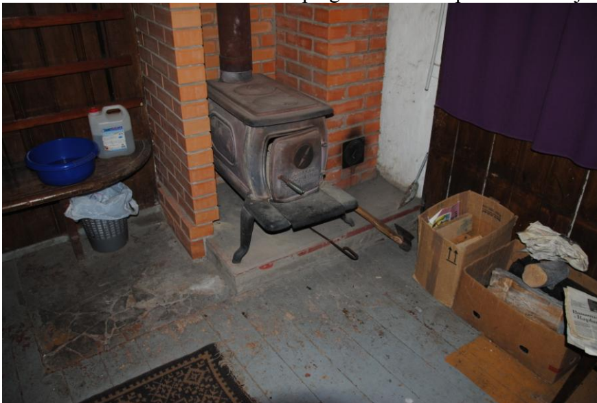
Foto 12 Käärkambri kütteseade

Käärkambri küttekolde ette ei ole paigaldatud mittepõlevat materjal.