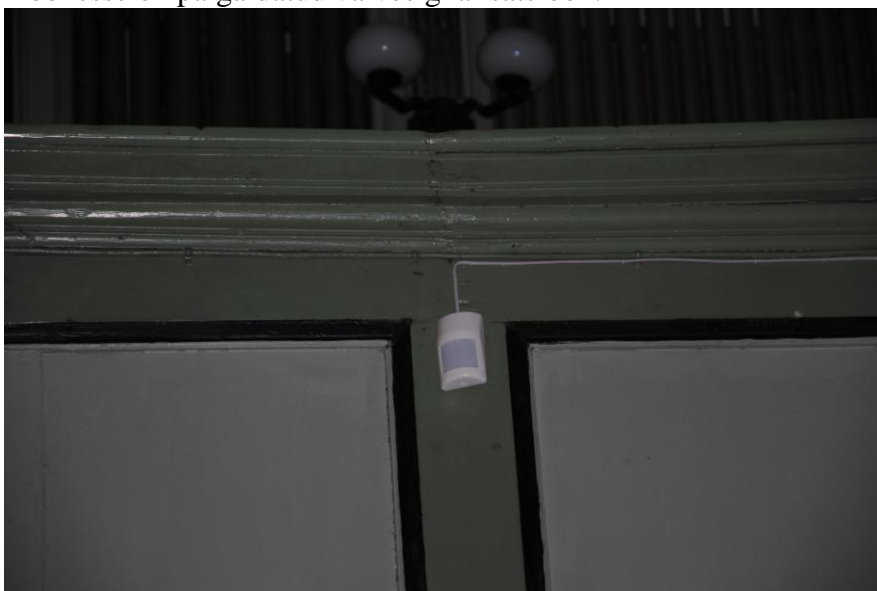
Foto 7 Hoonesse paigaldatud valvesignalisatsioon

Hoonesse on paigaldatud valvesignalisatsioon.