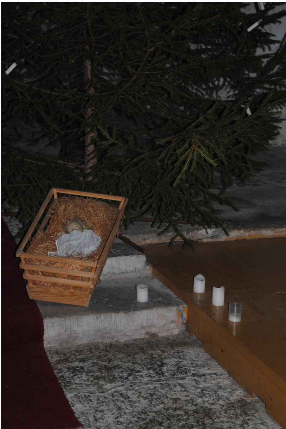
Foto 10 Küünalde kasutamine kirikus

Ruumide kütmiseks kasutatakse keldrikorrusel paiknevat ahju, mille abil toimub ruumide kütmine õhkkütte baasil saali toodud õhuavade kaudu.