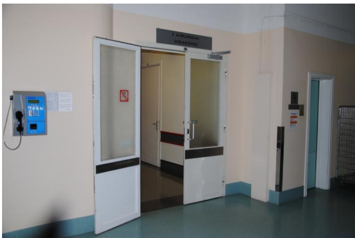
Foto 5 Tuletõkkeseksiooni avatud asendisse fikseeritud uks