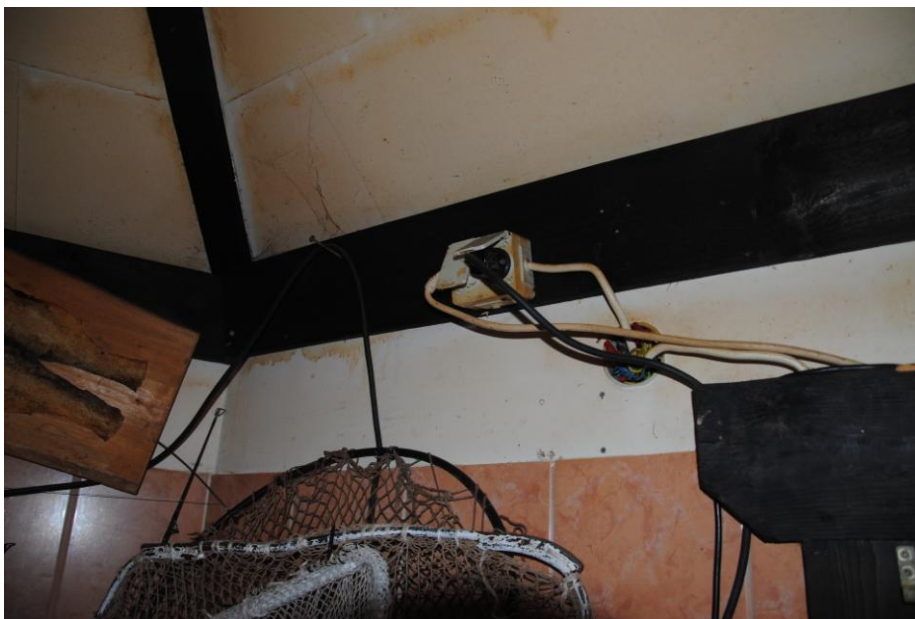
Foto 4 Kalaköögi elektrijuhtmestik