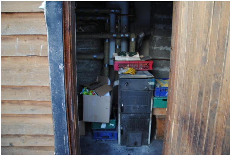
Foto 2 Peamaja katlaruum