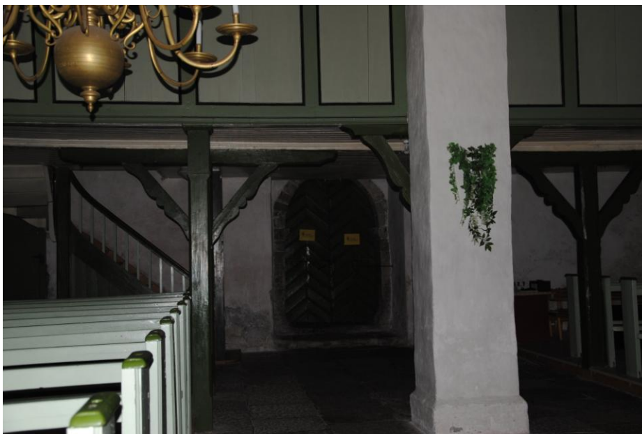
Foto 6 Evakuatsioonipäasu märgi nähtavus krikus

Hoonesse on paigaldatud valvesignalisatsioon.