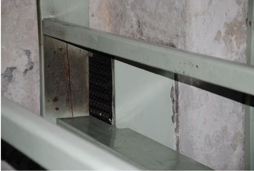
Foto 11 Hoone küttesüsteem

Ruumi maksimaalne laius on 12 m ning võlvide kõrgus 9,5 kuni 10,5 m. Ruumi pikkuseks on u 40 m. Ruumi liigendavad võlvlae kandepostid ning võlvide konstruktsioon.