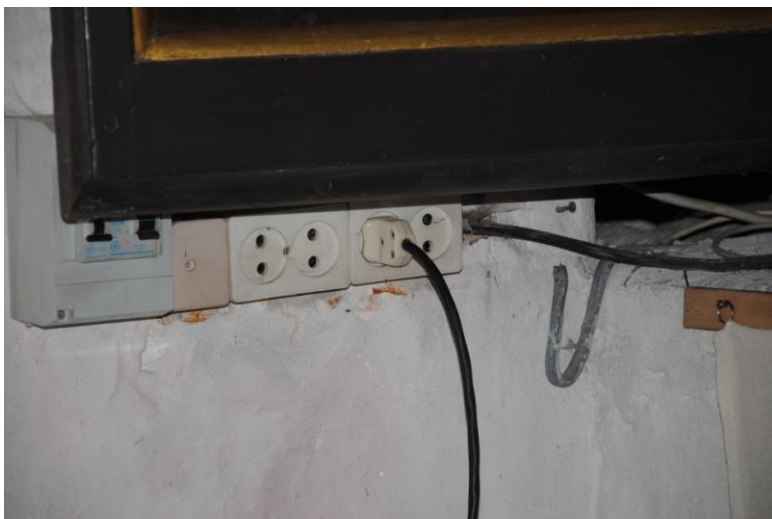
Foto 8 Hoone elektrijuhtmistiku seisukord

Hoones kasutatakse lahtist tuld (küünalde põletamine). Osaliselt on küünalde alla paigaldatud klaasist alused. Üldjuhul ei põle küünlad ruumis ilma pideva järelevalveta. Altari ümbruses on kasutatud palju tekstiili ning osa põrandast on kaetud vaipkattega.