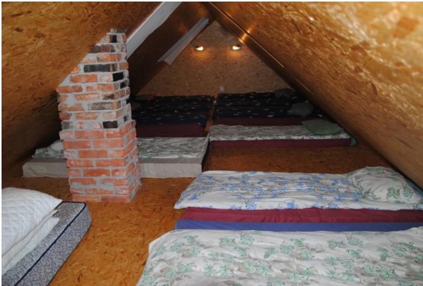
Foto 1 Peamaja kolmanda korruse majutusruum