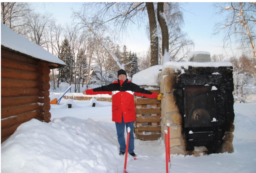
Foto 3 Suitsuahju ja kalaköögi vaheline ala